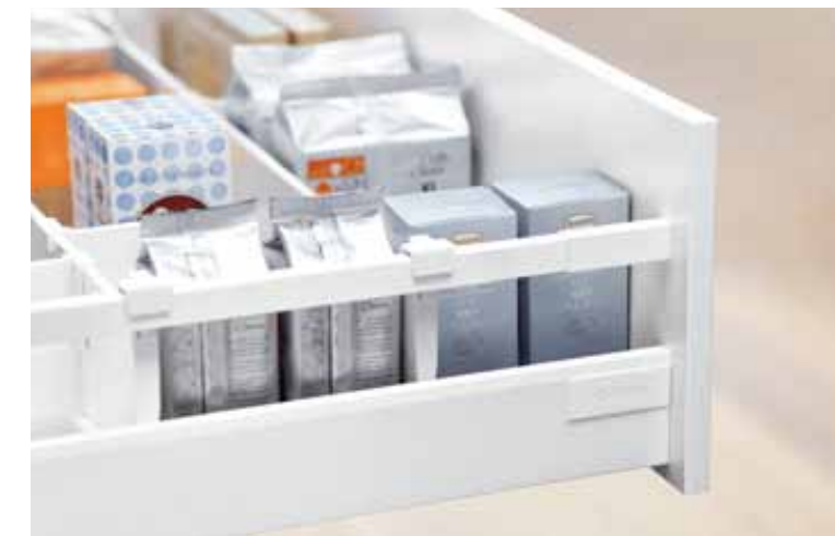
TANDEMBOX antaro está disponible en: Blanco seda

A menudo, menos es más: TANDEMBOX antaro confirma con creces esta regla. El color de todos los componentes coincide de manera uniforme: desde los cajones, los cajones interiores y el cacerolero hasta el cacerolero interior. Con el guardacuerpo esquinado es posible crear soluciones de armarios con diseño purista incluso detrás del frente.