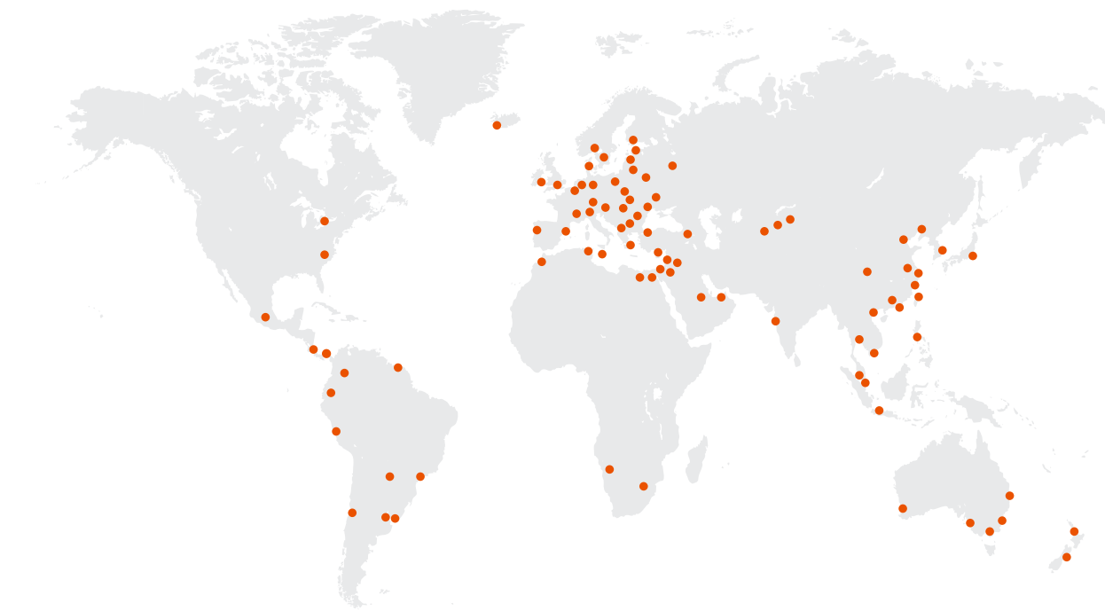
Presencia mundial: tenemos presencia local en muchos países a través de nuestras filiales y de nuestros representantes.